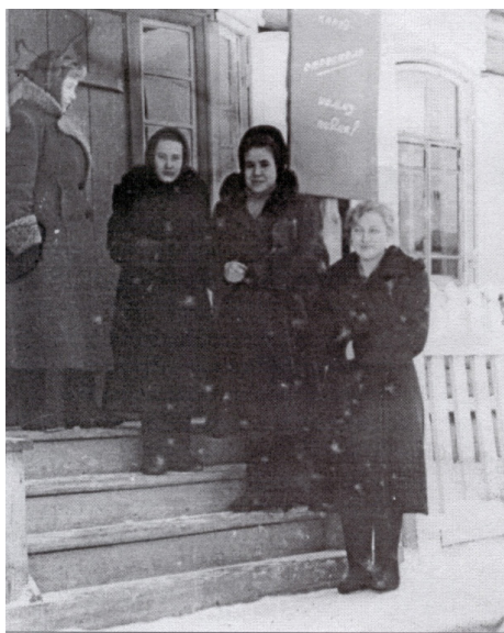
Старая Усть-Уда. Работники типографии возле здания редакции

Так у нас появилась собственная «районка», первый выход которой состоялся 1 мая 1934 года. Носила она тогда название «За большевистские колхозы», что вполне